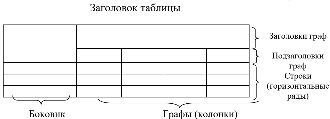
Рис. 1. Структура и вид таблицы

При переносе части таблицы на другую страницу слово «Таблица» и ее номер и заголовок указывают один раз над первой частью таблицы; над другими частями ставят слова «Продолжение табл.» и ее номер или «Окончание табл.» и ее номер.